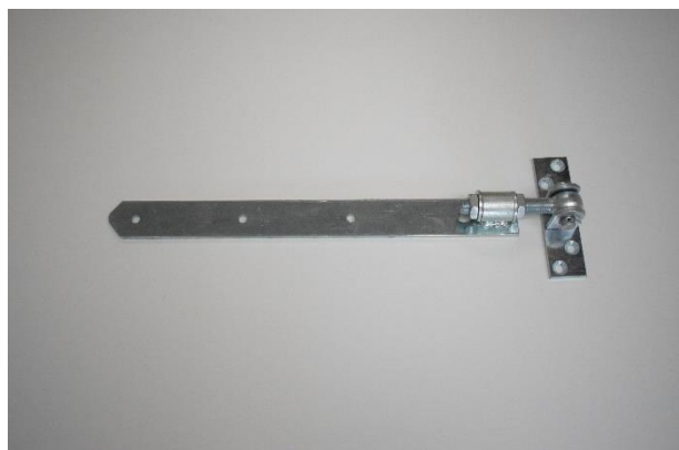
Verstelbaar duimheng 40 x 670 mm - gegalvaniseerd